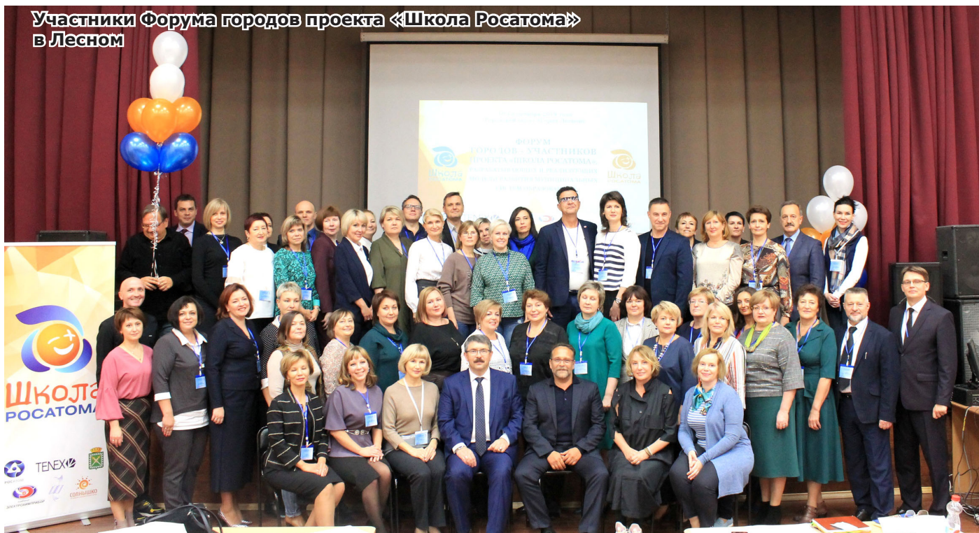
Участники Форума городов проекта «Школа Росатома» в Лесном