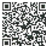
Информационные материалы о Библиотеке