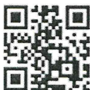
ФГИС «Моя школа»