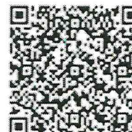
Педагогическая лаборатория по использованию контента