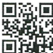
Универсальный тематический классификатор