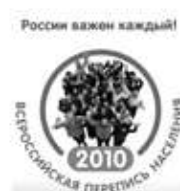
Всероссийская перепись населения 2010 г.