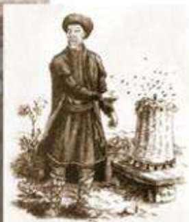
Татарин у пчелиного улья. С гравюры И. Заунера. XVIII в.

Мусульманский концерт. 16 января в Народном доме предполагается мусульманский концерт певца Фаттаха Латыпова.