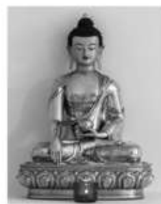
Статуя Будды в Буддистском центре г. Челябинска