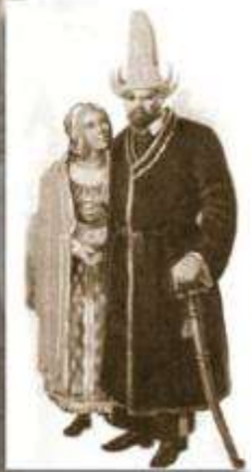
Башкирский тархан с женой

Основная часть башкир после взятия войсками Ивана IV Казани (1552) добровольно приняла российское