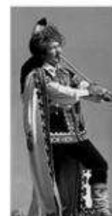
Музыкальный инструмент –