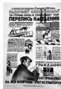
Первая Всесоюзная перепись населения 1926 г.