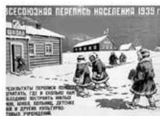
Третья Всесоюзная перепись населения 1939 г.