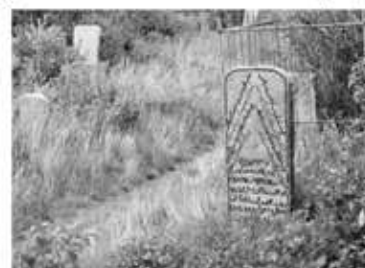
Кладбище в г. Троишке