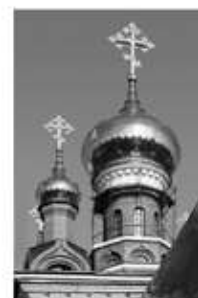
Купол храма Георгия Победоносца в г. Челябинске