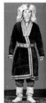
Мужской головной убор –

Сделайте подписи к иллюстрациям, указав, как называются традиционные элементы национального костюма, музыкальные инструменты и праздники башкир.