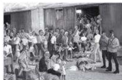
Депортация. Художник Бруно Даль

Познакомьтесь с документами и иллюстративным материалом, свидетельствующими об одном из самых тяжелых периодов в жизни российских немцев. Дайте свою оценку произошедшему. Проанализировав фотографии, запишите свои выводы о том, как в наши дни сохраняется память о трагедии немецкого народа.