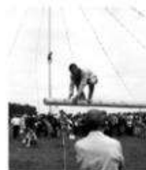
Праздник плуга –