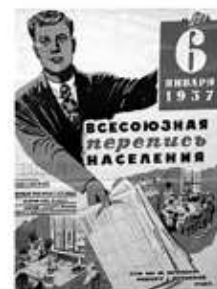
Вторая Всесоюзная перепись населения 1937 г.