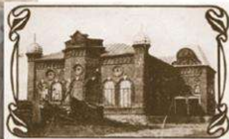
Синагога. Город Челябинск. С открытки XX в.

Подумайте, каковы были последствия подобных событий.