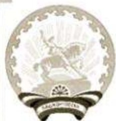
Герб Республики Башкортостан

Башкиры (самоназвание башҡорт ) являются основным населением Республики Башкортостан в Российской Федерации (1,2 млн человек). Башкирский язык относится к кыпчакской подгруппе тюркской ветви алтайской языковой семьи. Верующие башкиры в основном мусульмане-сунниты. По данным переписи 2002 года, в России проживает 1,6 млн башкир, в Челябинской области к этой национальности себя относят 166 373 человека. Башкиры являются коренным населением Южного Урала.