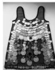
Женское нагрудное украшение –