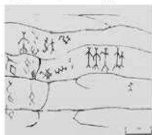
Писаница (озеро Б. Аллахи)

Определите, к какому религиозному учению можно отнести иллюстрацию: