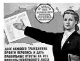
Четвертая Всесоюзная перепись населения 1959 г.